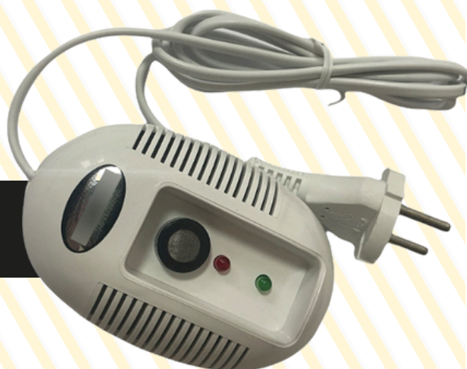
ПОКВАРТИРНІ ДАТЧИКИ ЗАГАЗОВАНOSTІ