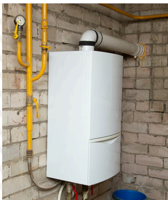
ГАЗОВІ/ ЕЛЕКТРИЧНІ КОТЛИ ВІДПОВІДНО ДО ПРОЄКТНИХ РІШЕНЬ