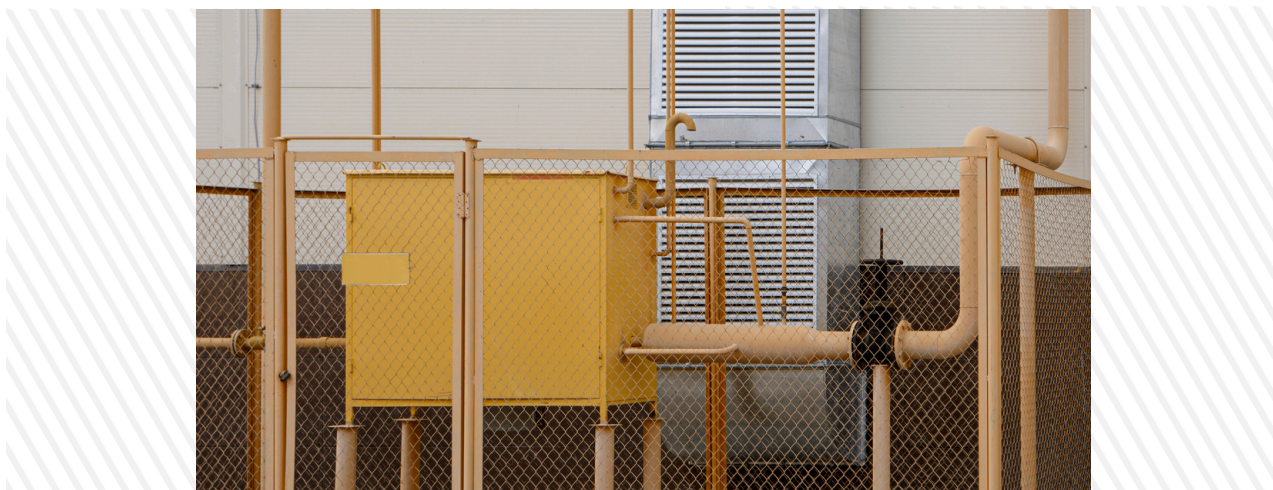
ЗМОНТОВАНИЙ ГАЗО-РОЗПОДІЛЬНИЙ ПУНКТ (ГРП) ВІДПОВІДНО ДО ПРОЄКТНИХ РІШЕНЬ