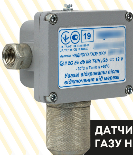
ДАТЧИК ДОВИБУХОВОЇ КОНЦЕНТРАЦІЇ ГАЗУ НА ВВОДАХ ІНЖЕНЕРНИХ МЕРЕЖ