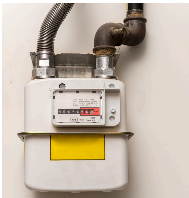
ІНДИВІДУАЛЬНІ ЛІЧИЛЬНИКИ ОБЛІКУ ГАЗУ